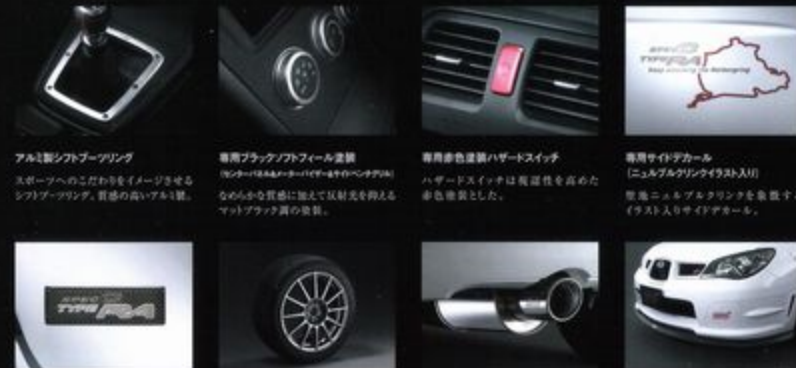
アルミ製シフトブーツリング